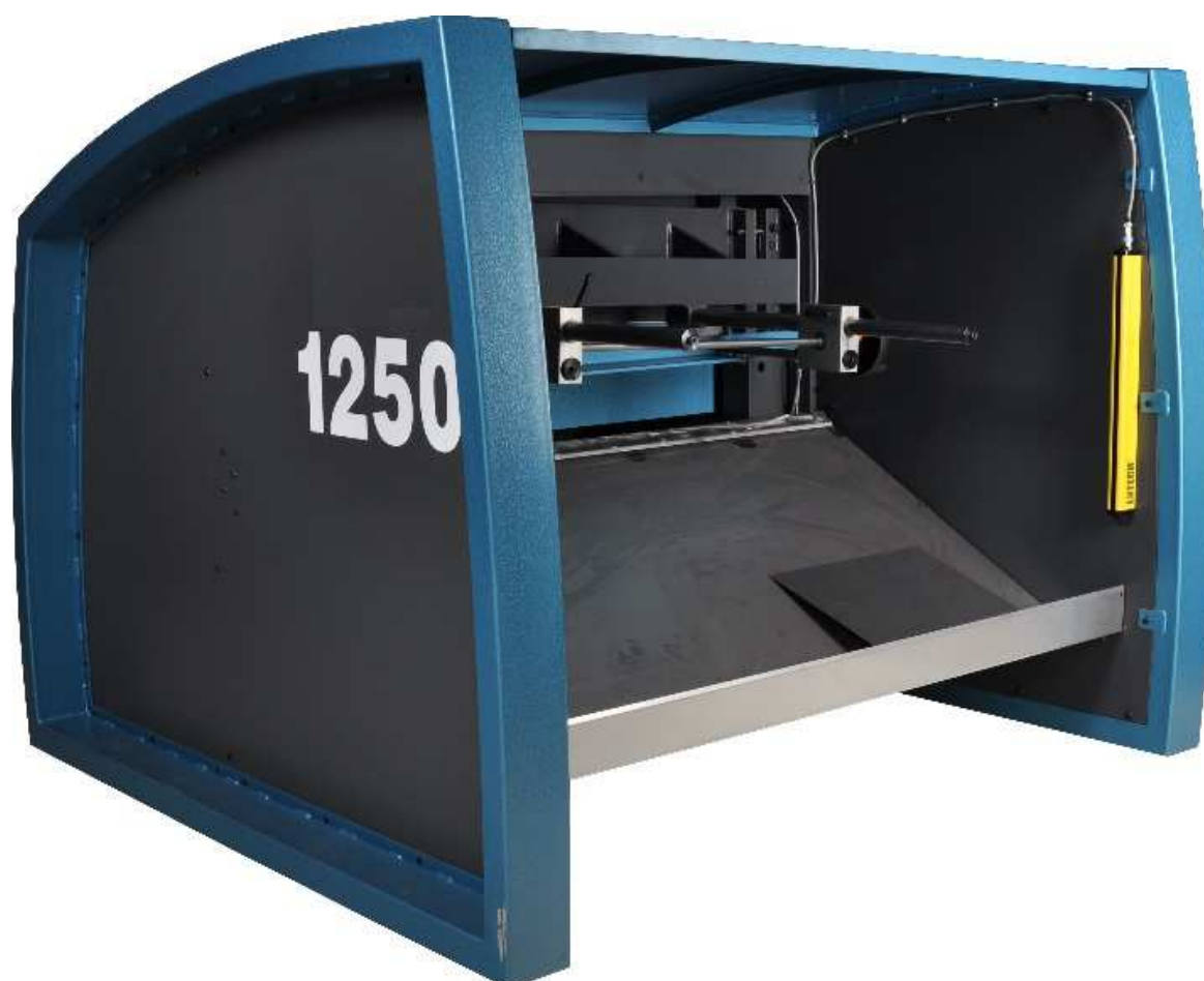
Barrières immatérielles – bac arrière de récupération grandes pièces