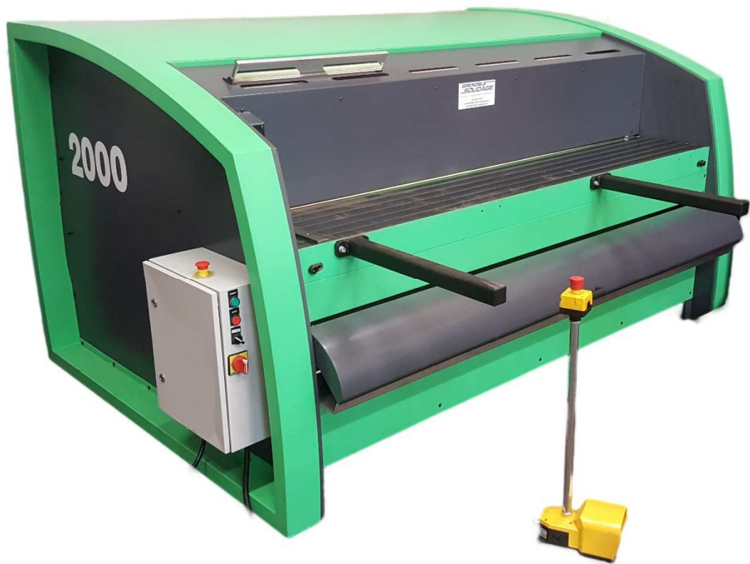
Modèle longueur 2000mm