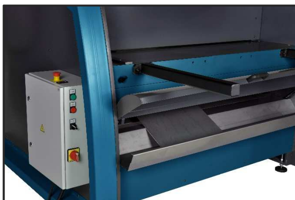
Bac avant récupération petites pièces