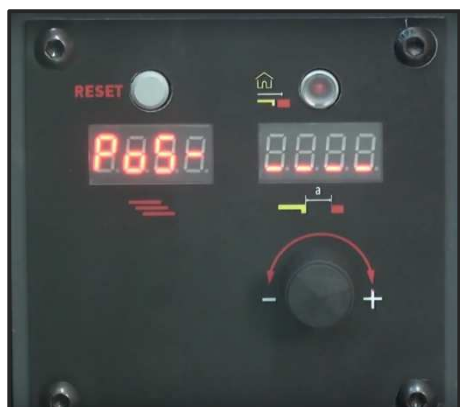
Butée arrière motorisée en option